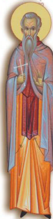
S F I O A N C A S I A N

Biserica NOTRE DAME DE LA MER 19 Place Jean XXIII 13460 SAINTES-MARIES-DE-LA-MER