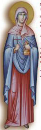
S F M A R I A I C O D I T A